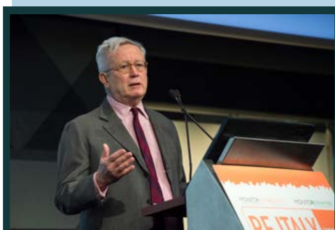
RE ITALY 2019 Convention Days: Lo scenario globale ed europeo. A cura di Giulio Tremonti