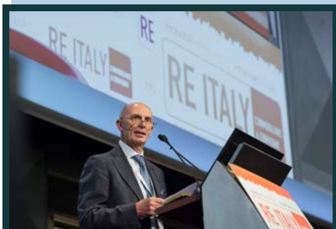
RE ITALY 2019 Convention Days: Il Demanio presenta il Piano di vendite immobili dello Stato. A cura di Riccardi Carpino