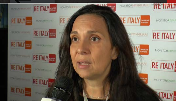
Simonetta Cenci Assessore all'Urbanistica, Comune di Genova