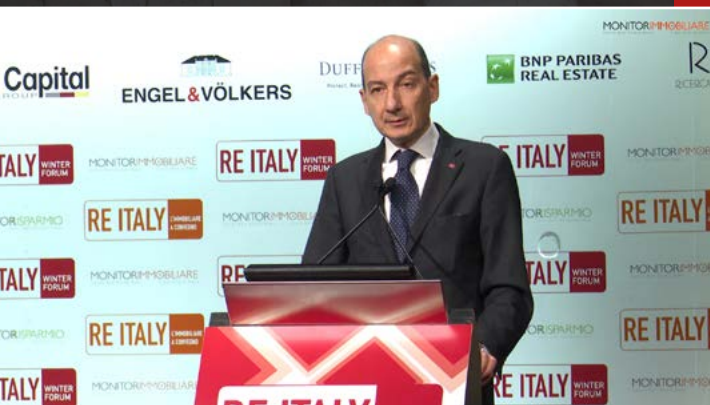
Giorgio Spaziani Testa Presidente, Confedilizia